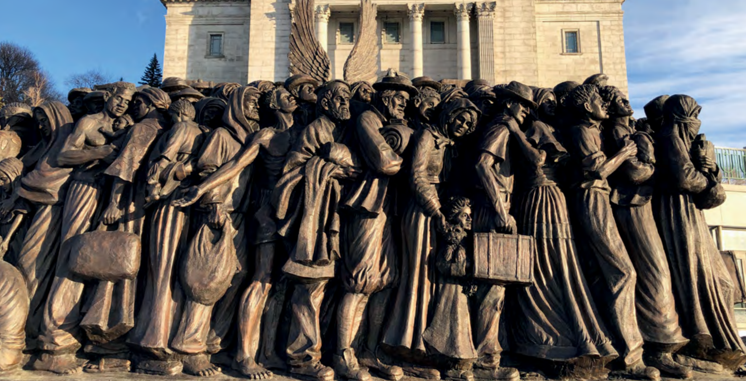
Photo : Angels Unawares, œuvre de Timothy Schmalz, L'Oratoire Saint-Joseph du Mont-Royal, N. Dumas.