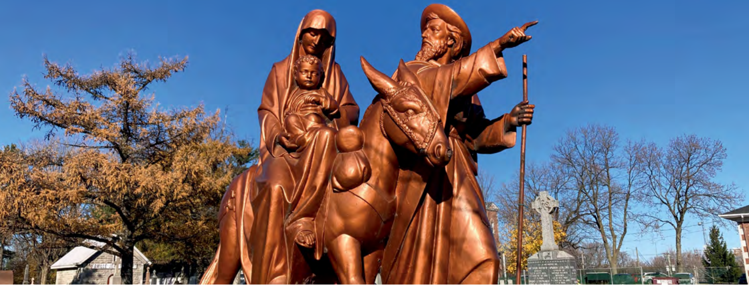
Photo : Monument de la Sainte Famille, cimetière Saint-Louis, Trois-Rivières, N. Dumas.